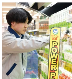
米沢中田町店グロサリー部門 S.Y. (3年目)

自分で売上をつくれて成果が見える小売業の仕事がしたいと思い入社。地元の優良企業であることも決め手になりました。山形の人々の食生活に直接関わることができ、売れていく商品を通してお客様の反応がダイレクトにわかるので、そこにおもしろさがあります。季節ごとの行事に合わせて売場をつくり、お客様の喜ぶ顔が見られて売上に繋がることがやがいです。