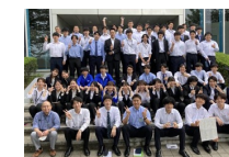
メーカー研修風景